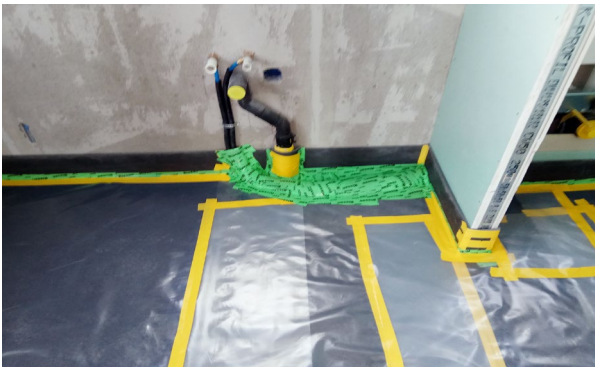
Rohrleitungen werden sauber entkoppelt und bojakendicht abgeklebt