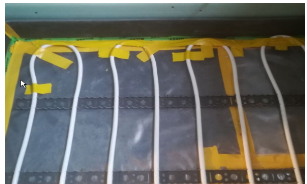
Die Distanzhalter der Bodenheizung dürfen nicht in die Lagerung gedrückt werden. Somit werden diese mittels Klebebandes fixiert bis der Estrich eingebracht wird