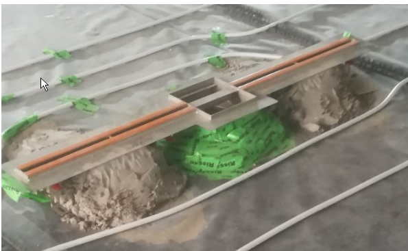
Eine andere Möglichkeit ist es, die Rinnen mittels Mörtelpatschen auf die exakte Höhe zu setzen