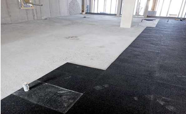
Exaktes Verlegen der 30 mm dicken, hochwertigen, gerillten Dämmplatten des Typs ISOPOL® 112-30-14