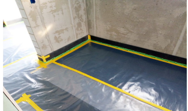
Die gesamte Lagerung wird bojakendicht abgedeckt und die Stösse bojakendicht verklebt