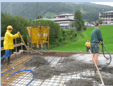
Betonvorgang durch Firma HBT-ISOL kontrolliert und abgenommen.