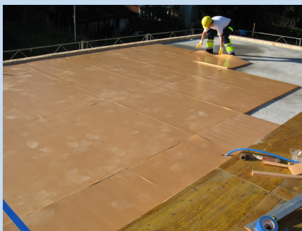
Dämmplatten ISOLMER verlegen für Doppeldecke über 1. OG.