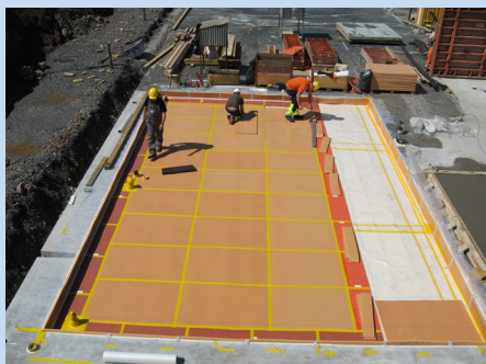
Lagerung der Bodenplatte mit unterschiedlichen Typen des Produkts ISOLMER, welche auf die Auflast dimensioniert wurden.

Weitere Informationen finden Sie auf www.hbt-isol.ch